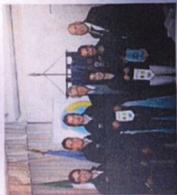
I protagonisti dell'interesting Lions - Panathlon